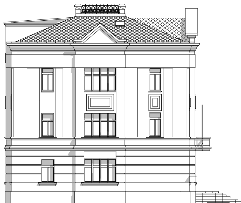
Pohled severní - stávající stav