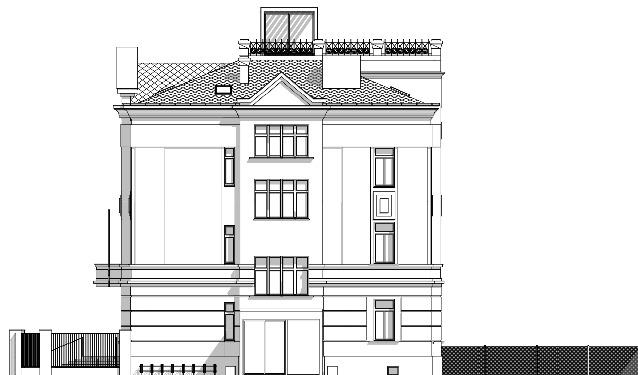
Pohled jižní - nový stav

Využití budovy č.p. 449, Palackého třída, Nymburk - studie 06/2023