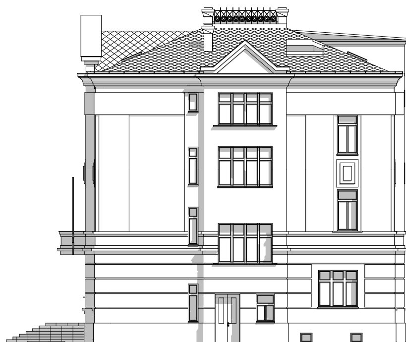
Pohled jižní - stávající stav